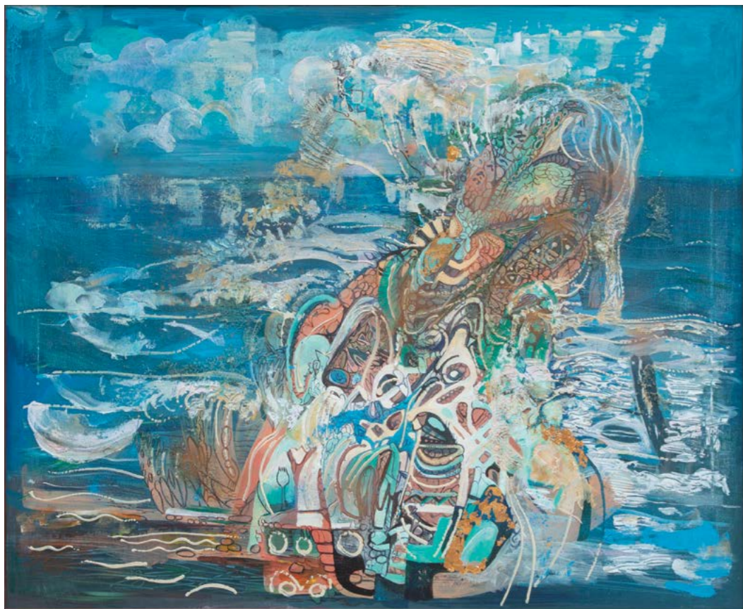
Раввин Овадия Исаков «Странствие» Москва, 2023 Холст, акрил

Во всех странствиях в жизни следует быть там, где вы есть. Мы можем миновать что-то на пути, нечто кажущееся более важным, - но сейчас, именно в этом месте есть цель.