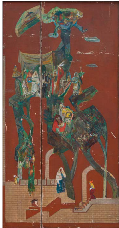
Раввин Овадия Исаков «Вне контроля» Калининград, 2019 Холст, акрил

В ряде случаев мы видим, что дела как бы выходят из-под нашего контроля и продолжают свой путь сверхъестественным порядком. Тогда остается только делать то, что следует, и не мешать Б-гу.