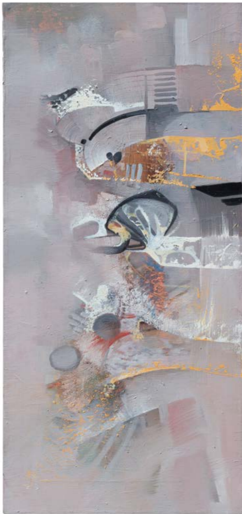
Раввин Овадия Исаков